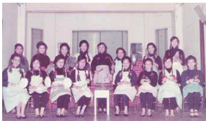
婦女部於遊藝會表演廚具樂隊

「婦女們還有一件大事，這便是在遊藝會中表演，憶記其中有一次，婦女們穿上廚師服飾，頭髮結成孖辮，手拿廚房煮食用具，如煲、鍋、鑊、刀、叉、碗、碟、茶壺等作樂器，奏出美妙樂章，令觀眾抱腹大笑，認真難忘。」