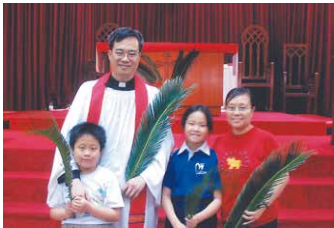
2005年棕枝主日攝於澳門聖馬可堂

9月徐牧師被調回香港，出任堅尼地城聖路加堂主任牧師，侍奉滿100個月後，奉鄭保羅大主教之命調派至本堂繼續牧職。