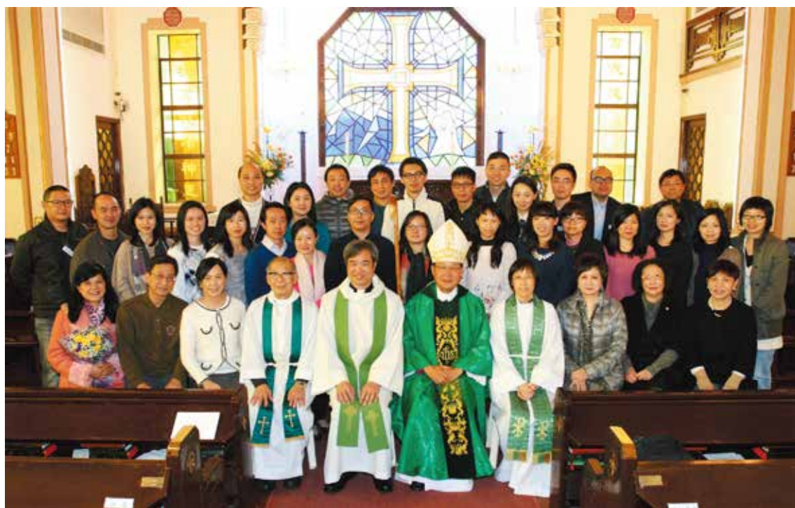
聖餐崇拜暨堅振禮後眾新葡與鄭保羅大主教及本堂聖品合照