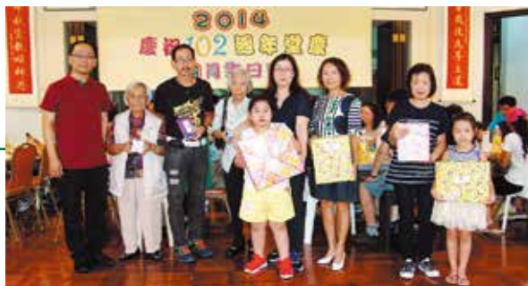
102週年堂慶聯歡聚餐時舉行幸運抽獎