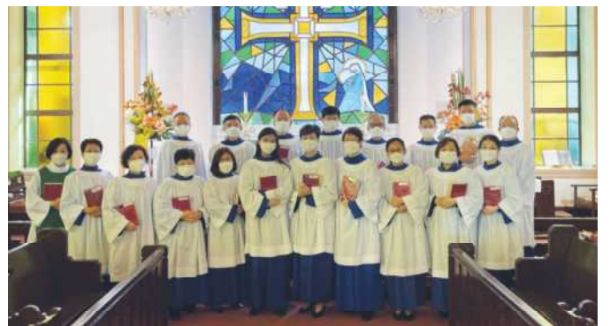
參與「一人一詩 110」的本堂詩班員合照