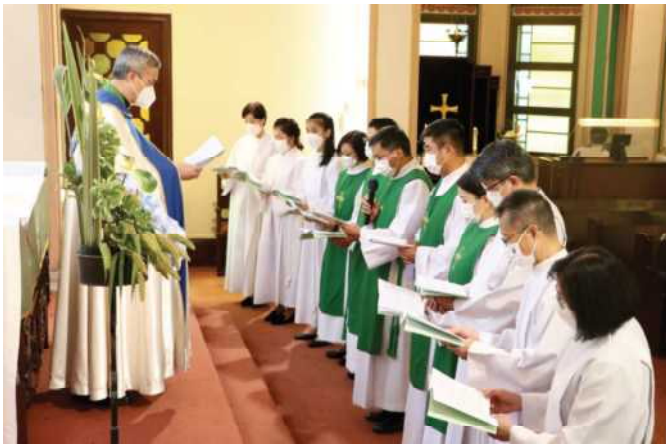
2022年8月14日侍從差遣禮

2022年因著疫情的發展，崇拜由實體參與改為網上進行，聖壇侍從在崇拜中的事奉亦需要暫停下來。而除了疫情的困擾外，侍從部的數位同工因著各自的發展而暫停聖壇侍從的事奉。情況就如天色瞬間的變化一樣；早陣子天空仍是春光旖旎，下一刻已是烏雲密布，令人當下感到無奈。感謝上主，祂用一首隨歲月已被遺忘了的聖詩提醒我，歌詞是「神未曾應許天色常藍，常樂無痛苦，常安無虞。但神卻應許試煉得恩助，危難有賴」。在網上崇拜，留家抗疫的日子裏，上主讓我停下來，歇一歇，重新思考侍從部未來的發展及方向。