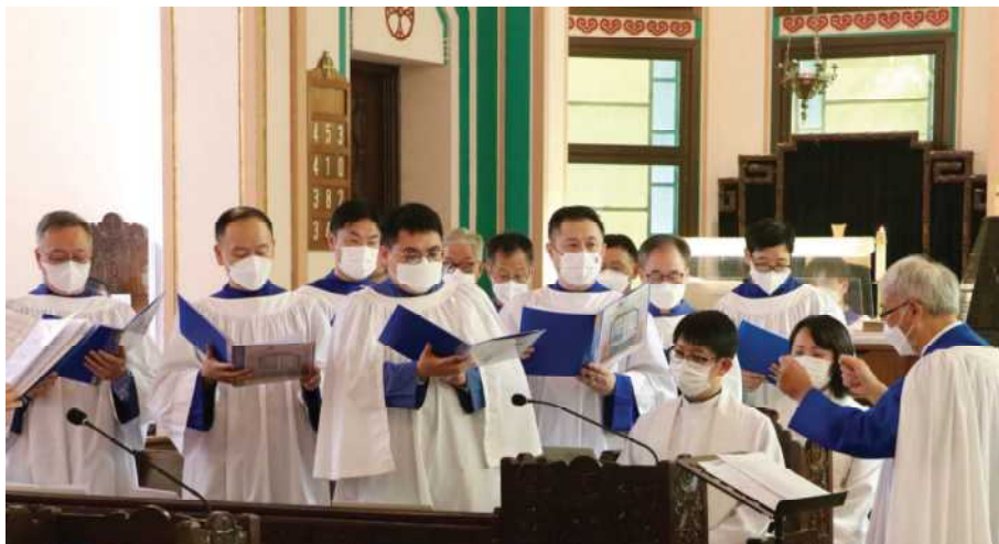
詩班獻唱Charles V. Stanford譜的《讚美頌》