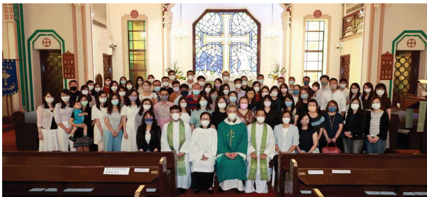
校長和老師參加9月18日早堂教育主日