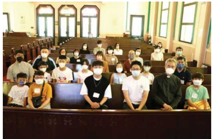
2022年8月20日聖壇侍從工作坊

8月20日侍從部舉辦了一次「侍從工作坊」，當天有23名教友參加。工作坊分兩部份進行：第一部份介紹聖壇侍從的起源、禮儀的理念及目的；第二部份由勞牧師講解聖公宗神學與禮儀的關係；最後，以體驗侍從工作作為結束。