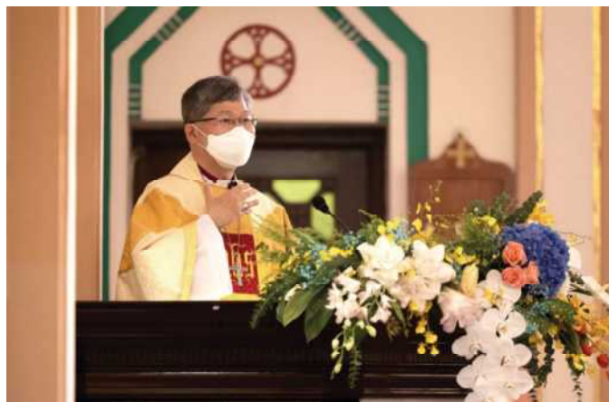
陳謳明大主教講道