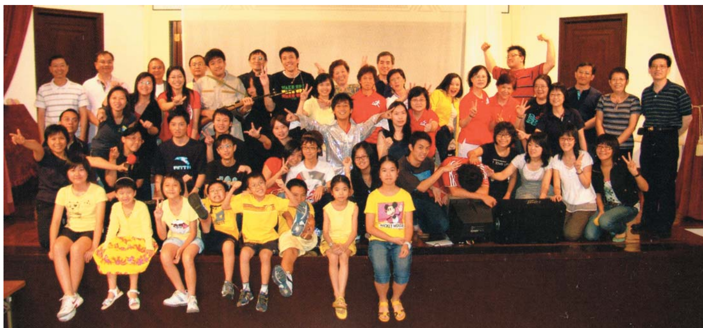
馬堂九十五周年堂慶音樂劇「恩典留痕」劇照

黃氏家族感謝主賜予各人一直以來身體健康，生活安定，恩典夠用！願主繼續祝福黃氏家族，讓各人繼續在香港聖公會聖馬利亞堂不同事工中盡心、盡性、盡意、盡力去侍奉主。