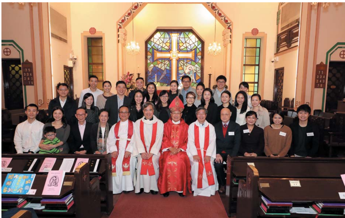
堅振禮後廊大主教與本堂聖品及受禮新葡合照