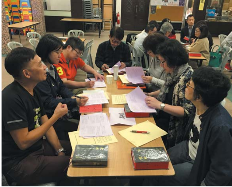
參加者分組討論，一同學習

我透過參加兩次的工作坊，讓我認識到四福音的寫作背景及目的，由於各卷書的寫作背景不同，故各福音書的側重點也有不同。例如：馬太福音的寫作對象是猶太人，具濃厚的猶太色彩，猶太人十分重視律法傳統。作者是為在猶太信仰傳統中掙扎的基督徒而作，耶穌是上帝律法的鑰匙。故此馬太福音一開首便寫上耶穌基督的家譜。這一切是我從前所不認識的。透過深入淺出的解釋，把四卷福音書的特點逐一說明，還附上鞏固練習，加深印象。