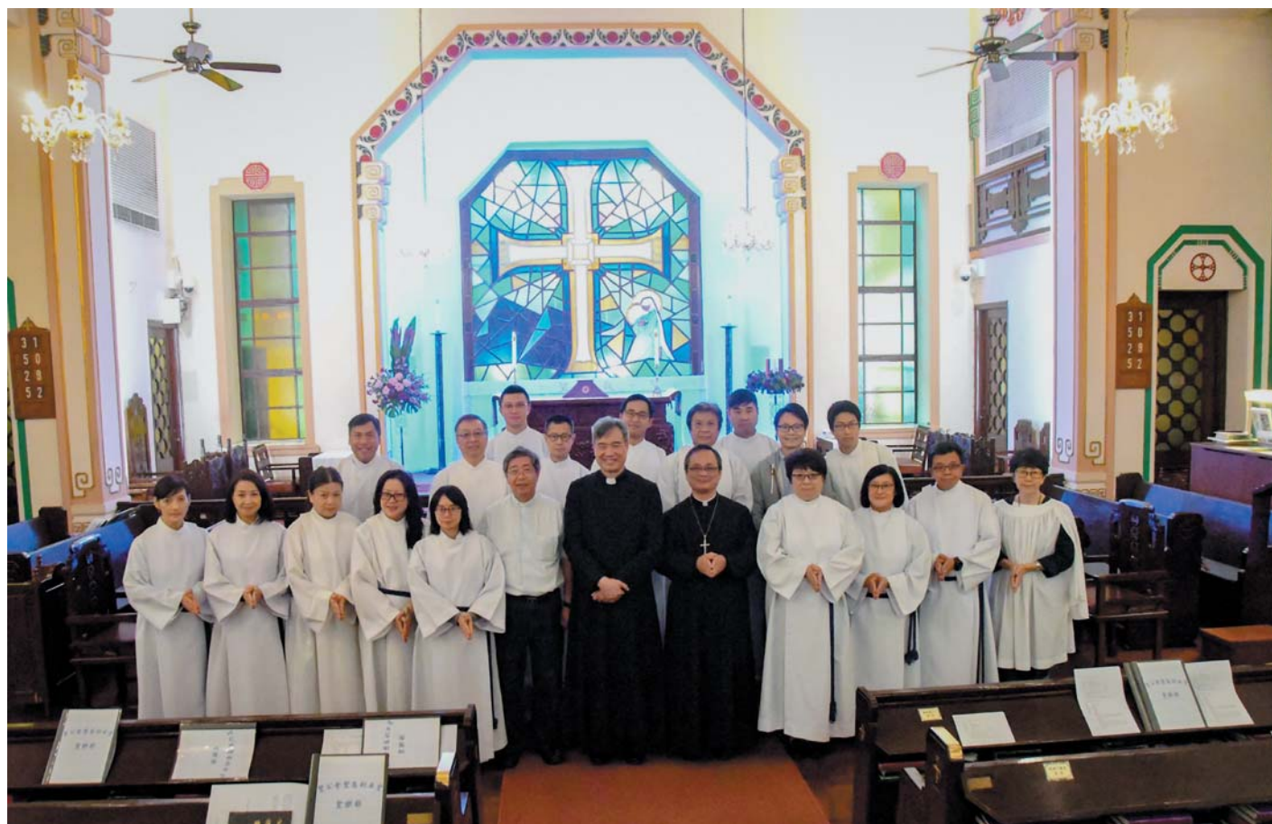
參加者與三位牧者及司琴合照