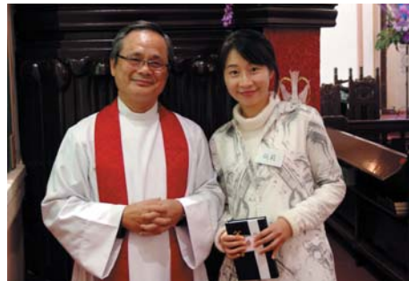
錢 莉 ● ● 保證人：霍振堅、潘景和、黃文青、張海燕