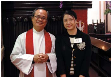
李 莎 ● ● 保證人：張景濤、潘景和、張海燕、梁懿雯