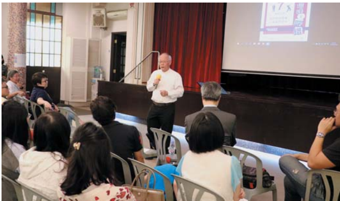
張牧師為教友們解答基督徒應如何處理習俗的問題

A3 犯太歲這些事，你信就會有；你不信就不會有。那我們為何要背負那麼多包袱呢？其實有些包袱是不需要背負的，亦不需要相信，最緊要是「有事發生唔好賴」。