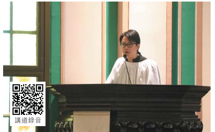
2019年1月13日基督領洗日（顯現期第一主日）首次在本堂講道