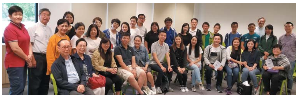
預備領洗/領堅振者與兩位牧師及同行者參加10月20日在薄扶林「香港傷健協會賽馬會傷健營」舉行的學道班退修會