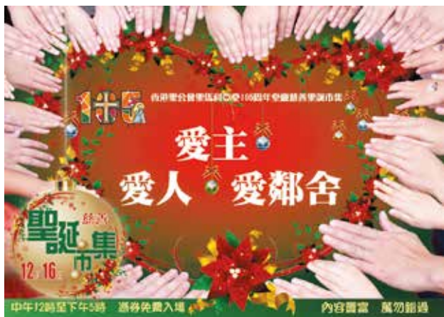
「聖誕市集」的宣傳海報由教友們的一雙雙手構成心形圖案，代表關愛社區之心

「聖誕市集」的佈置工作早在舉行前的週四開始，教堂的花園掛上了七彩繽紛的小旗幟，而副堂舞台上則用紅、綠、白色的氣球砌成天虹、聖誕樹和雪人等配合聖誕節主題的立體塑像。而到了週六那一天早上9時，工作人員已開始陸續到場佈置各