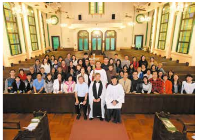
晚禱崇拜後全體合照

「12.3全堂退修會及獻心禮」那天剛好也是「香港福音盛會2017」（見本期有關報導），但結果也有105人參加了退修會，實在十分感恩。其中有4位到來的非教友是在等福音盛會開場時「路過」進來的，到底是聖馬利亞堂的建築設計吸引他們？是因為我們的大門打開？還是我們讚美主的歌聲？無論是什麼原因，這都是上主巧妙的安排，也是主給我們的啟示，就是要我們時常讚美祂、敬拜祂，也要我們邀請其他還未信主的人來認識祂，這是作為基督的門徒一即「活魚」最重要的使命。