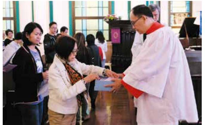
晚禱崇拜期間舉行獻心禮，會眾把獻心封放進盒子

全堂退修會後就是晚禱環節，當中在唱【求作遠象歌】後進行獻心禮，會眾逐一上前把獻心封放進侍從手持的特別獻心盒子，隨後再以祈禱及祝福結束。獻心封保存於主任牧師房，待2018年將臨期送回給各人。