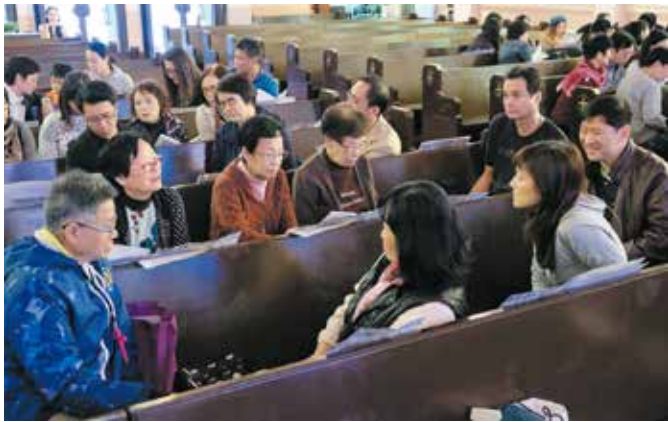
分組討論有足夠時間讓每人表達個人感想

分組討論後，每組的組長便走到會眾席前，逐一向大家總結各組員的回應，例如他們在那方面有特別的恩賜可以事奉教會。總結後為獻心禮做準備，每位參加者把個人實踐六個門徒身份的承諾寫上「獻心紙」，放入信封，信封上寫上自己的名字。