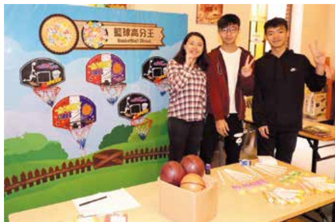
聖馬利亞堂莫慶堯中學同學設計的「籃球高分王」射籃遊戲