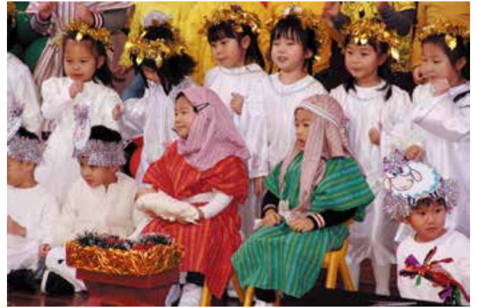
可愛的聖公會幼稚園同學扮演「聖景」的不同角色