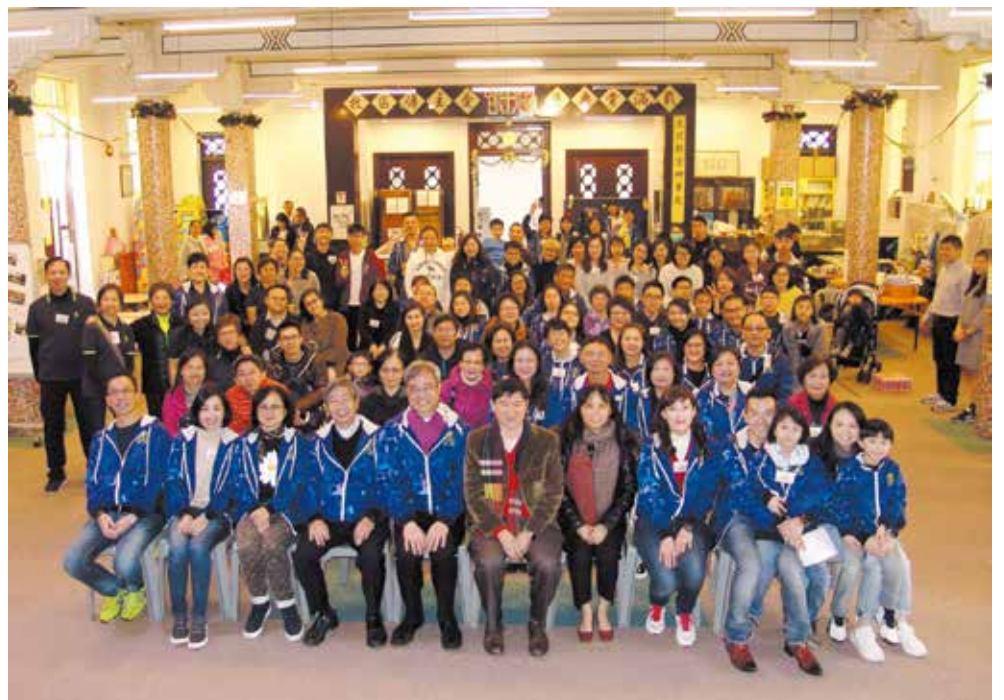
「聖誕市集」籌備委員與全體工作人員大合照

「聖誕市集」在下午5時正式閉幕，估計當天大概有500人次到場參加。而整個活動透過售賣美食券、遊戲券、精品義賣、慈善表演和慈善拍賣，一共有接近8萬元收入，扣除支出後淨籌得6萬7千元。最重要是所有參加者都闔家同歡，盡興而返。有如此美滿的佳績，實在有賴各位教友義工和幹事同工的 effort，也感謝天父上帝當天賜予晴朗的天氣和保守活動的順利進行。