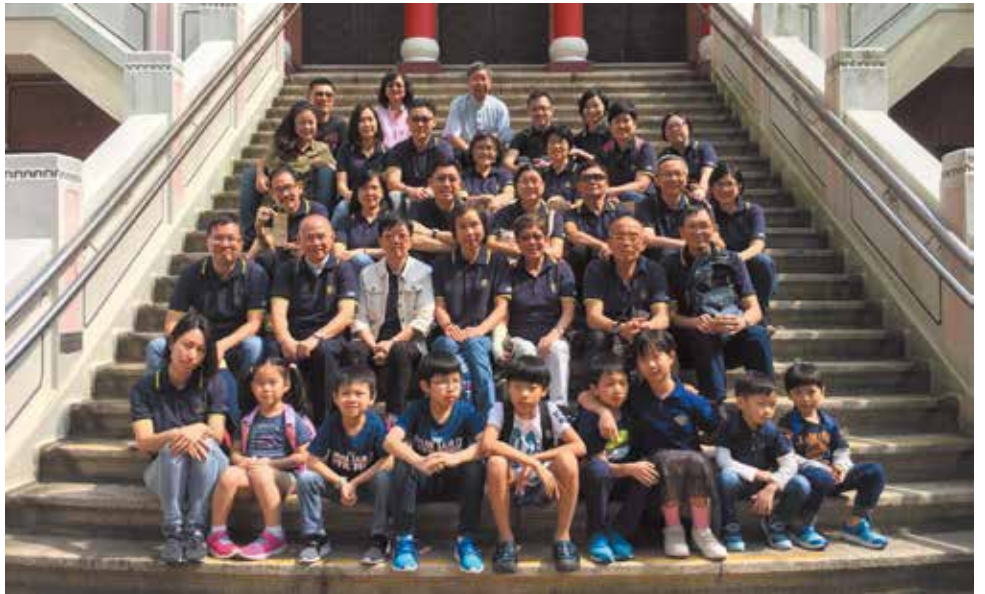
2017年10月22日本堂義工參加祈禱暨動員大會出發前大合照

主題為「主愛臨香江」佈道大會已於2017年11月30日至12月3日假香港大球場舉行，同時假元朗大球場現場直播。一連七場包括晚間四場公開場、日間學生場、普通話場及英語場，信徒出席人數超過十萬。每場有見證分享、獻唱及信息分享，聚會結束前牧師呼召決志者到台前接受陪談員跟進，並為他們祈禱祝福。最後一場結束前，大會邀請鄭保羅大主教為佈道會完滿舉行祝福。