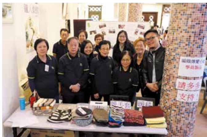
「編織傳愛小組」義賣他們親手編織的毛冷衣物