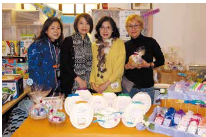
手工香皂和潤膚品在寒冷和乾燥的天氣熱賣，全部售罄