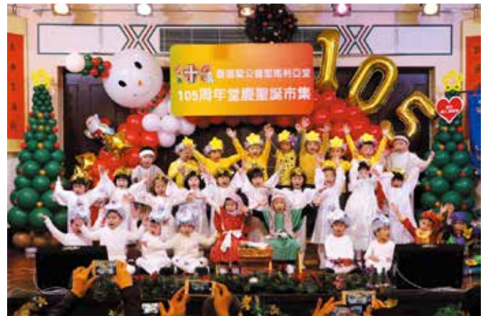
同學獻唱三首聖詩歌向大家報佳音