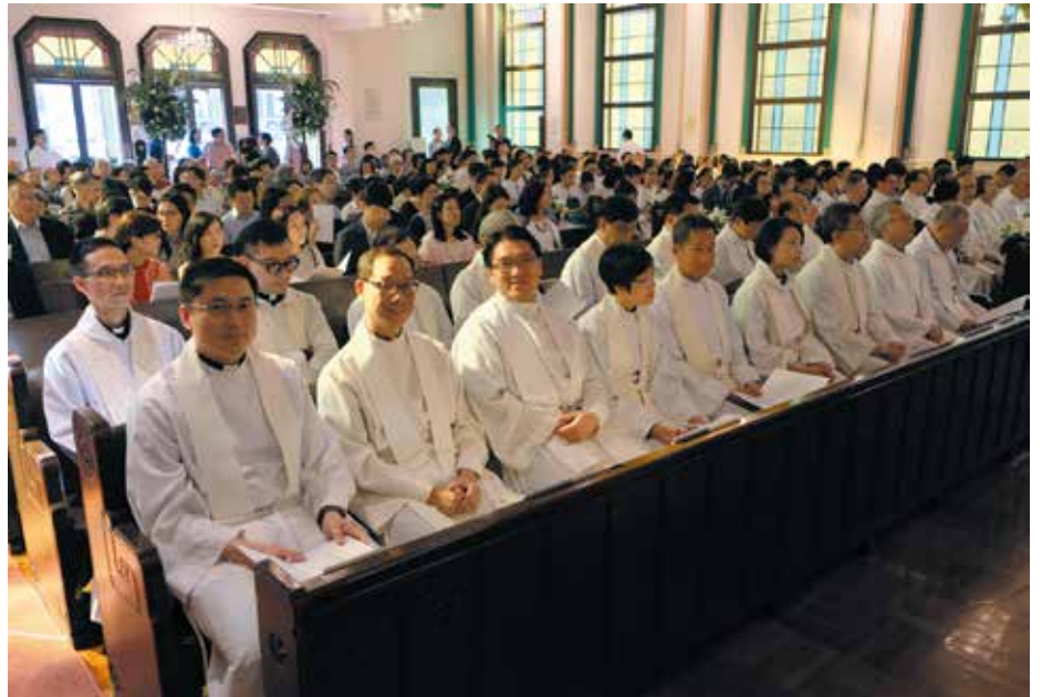
參加感恩崇拜的教省聖品