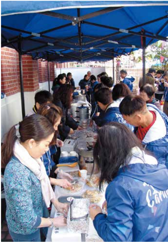
藍色帳篷下的美食區整個下午忙個不停