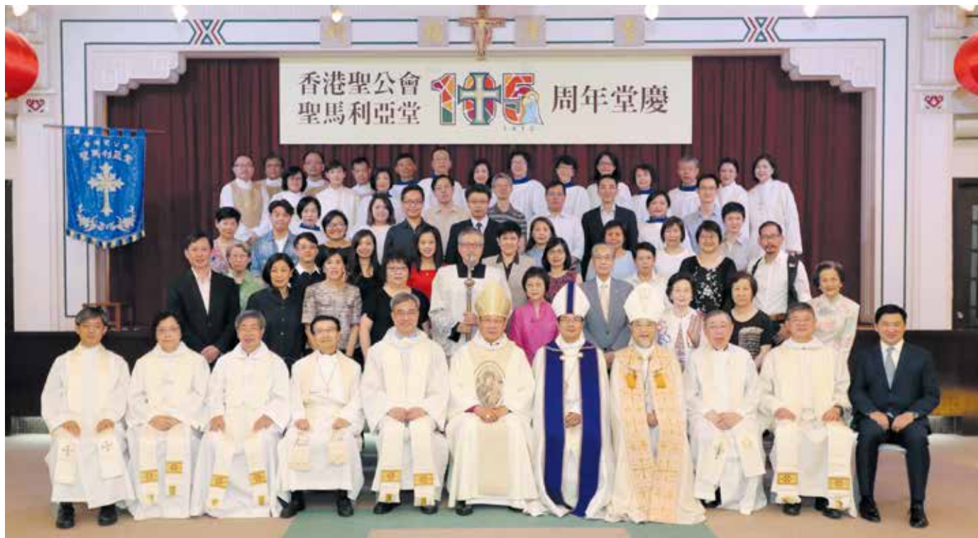
105周年堂慶感恩崇拜前主禮與本堂牧區議員大合照