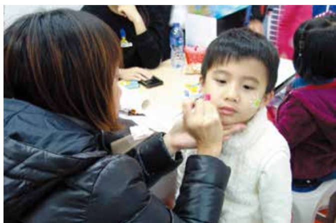
彩繪員細心地在小孩臉上畫上圖案

至於副堂外的庭園就是「美食義賣」集中地，藍色的帳篷下密密麻麻地展示各式各樣的環球美食，有南洋風味的海南雞飯、歐式香腸、地道的「碗仔翅」、豬腳薑、咖喱魚蛋和美式巧克