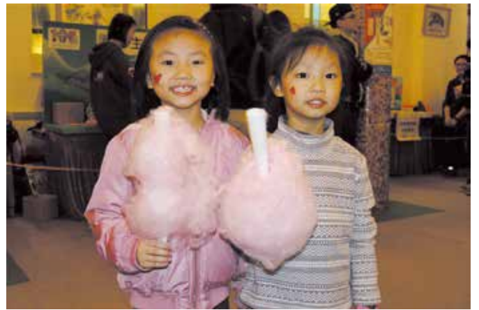
小朋友很喜歡粉紅色的棉花糖

「聖誕市集」在下午5時正式閉幕，估計當天大概有500人次到場參加。而整個活動透過售賣美食券、遊戲券、精品義賣、慈善表演和慈善拍賣，一共有接近8萬元收入，扣除支出後淨籌得6萬7千元。最重要是所有參加者都闔家同歡，盡興而返。有如此美滿的佳績，實在有賴各位教友義工和幹事同工的 effort，也感謝天父上帝當天賜予晴朗的天氣和保守活動的順利進行。