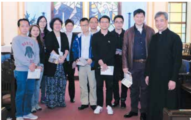
十位組長在作匯報前與徐牧師合照

分組討論後，每組的組長便走到會眾席前，逐一向大家總結各組員的回應，例如他們在那方面有特別的恩賜可以事奉教會。總結後為獻心禮做準備，每位參加者把個人實踐六個門徒身份的承諾寫上「獻心紙」，放入信封，信封上寫上自己的名字。