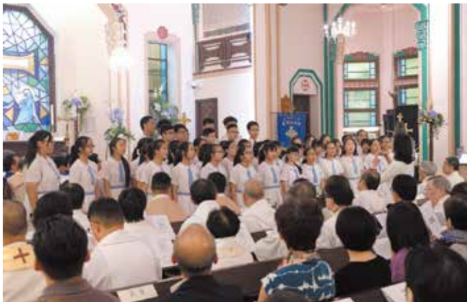
聖公會聖馬利亞堂莫慶堯中學同學獻唱John Rutter的“Look at the World”【觀看宇宙】