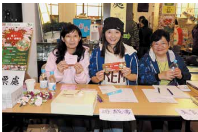
玩遊戲和購買美食前要到售票處換購5元一張的遊戲券和美食券

力布朗尼蛋糕（Brownie）等，當然少不了最受小朋友喜愛的爆谷和棉花糖，所有食物都是由教友們親手製作，不少在市集完畢前已售罄。