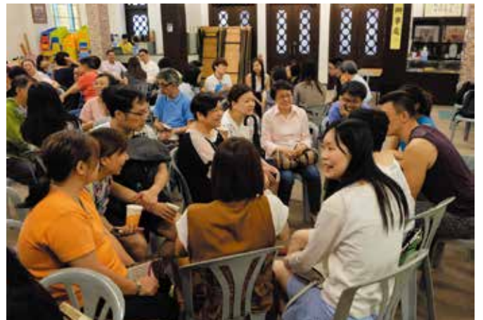
每次范Dean分享後都預留時間讓參加者作分組討論，讓會眾反思經文中的訊息