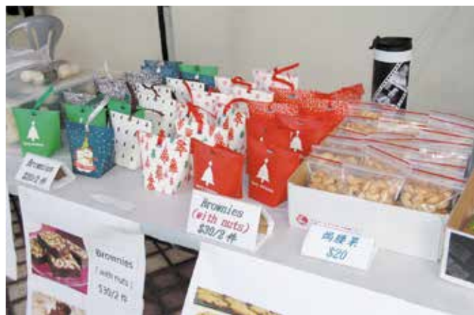
配合聖誕節主題包裝精美的Brownies