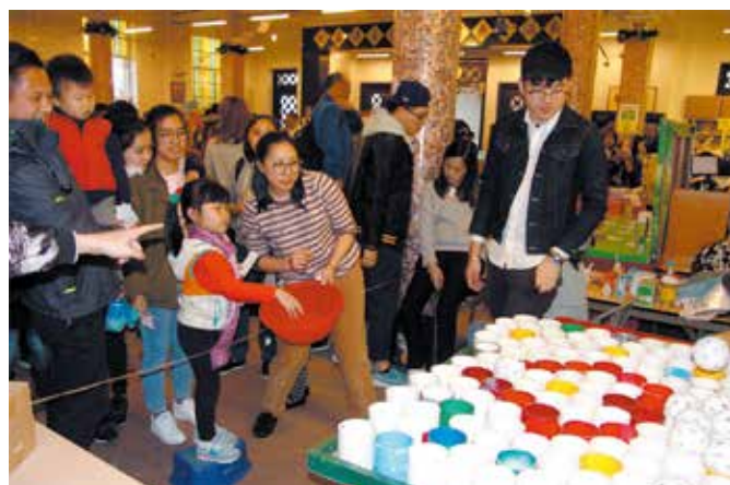
投球遊戲和其他攤位遊戲一樣難度不高，很容易得獎