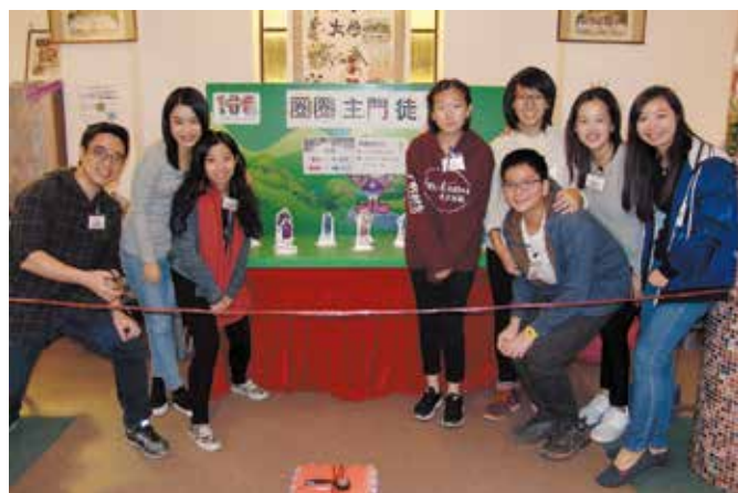
青少年部負責的「圈圈主門徒」遊戲讓參加者認識跟隨耶穌基督的門徒

美術作品義賣，及由教友捐出的手工香皂和潤膚品義賣。還有在花園教室的面部彩繪，有不少小朋友都興奮地讓彩繪員在他們臉上畫上聖誕主題及其他可愛的圖案。