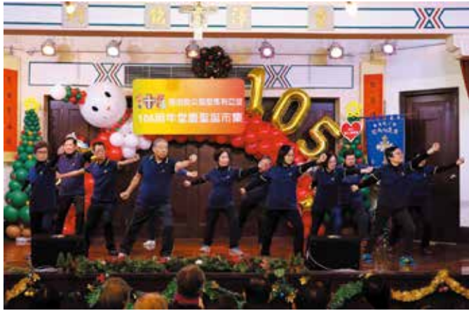
「易筋經」組員的表演功架十足