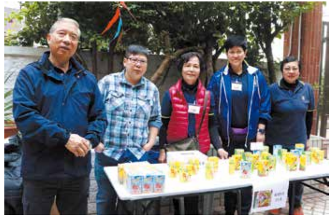
享用美食時買盒裝飲品生津解渴