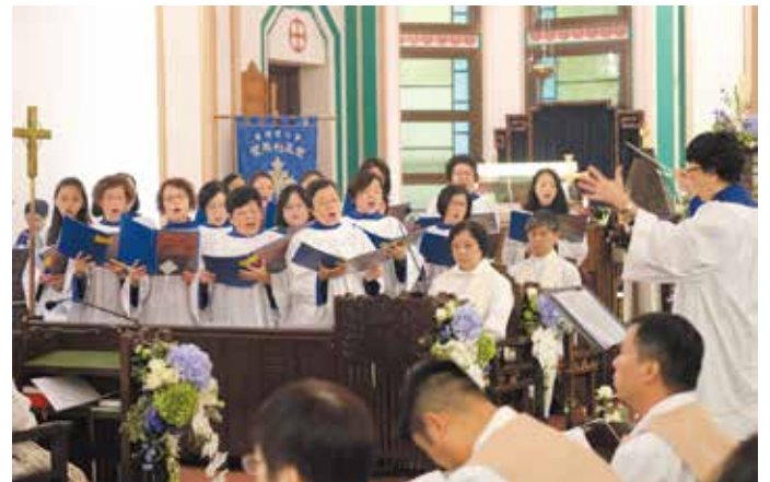
本堂詩班獻唱Craig Courtney的“One Faith, One Hope, One Lord”【一信，一望，一主】