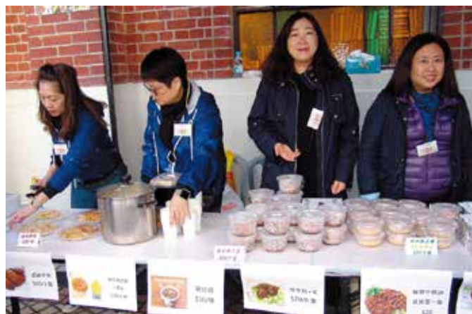
中、西美食皆由教友們親自製作和售賣