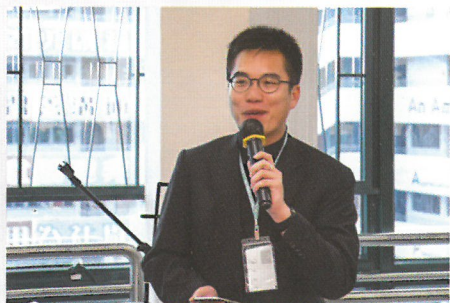
陳牧師信息分享並帶領泰澤詩歌

成年部已定於本年7月8日及11月11日進行另外兩次外展探訪服務，希望能夠得到你的支持，參與是項極具意義的事工。