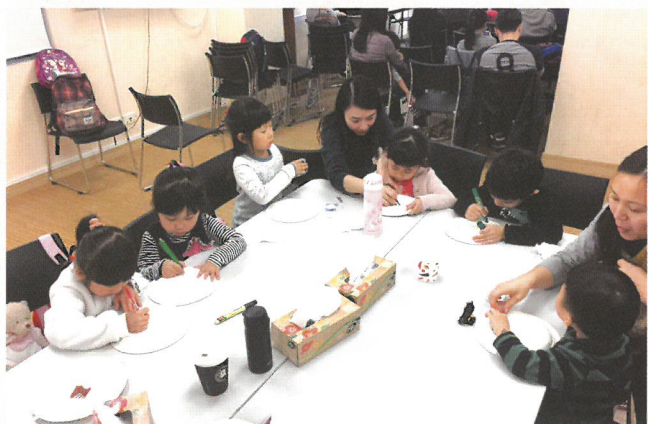
小朋友認真做勞作