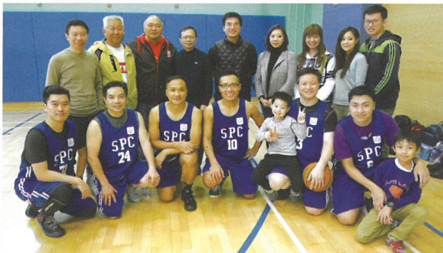
精神抖擻的健兒，牧師教友來支持。

最後，雖然我們以七分在賽事中排列第四，但是我們從中都獲得到團隊合作的歡樂；這真是一項精彩、難忘、令人回味的教區活動。