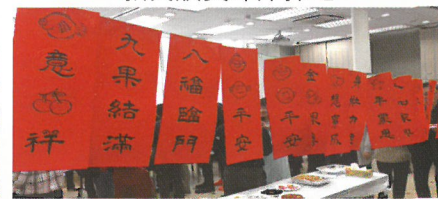
筆觸剛柔得宜的揮春