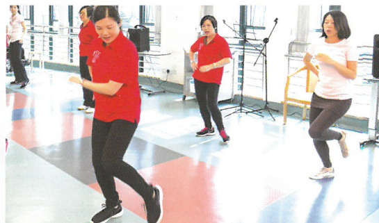
讚美操組以一曲《享受恩雨》讚美上主