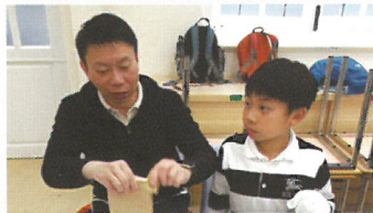
父子兵上陣——親子靈修

小記當日也是參加者，看到姊妹們認真地製作愛心湯，中午時快速的佈置副堂，上工作坊時的認真、安靜與投入，連小記都不敢打擾他們抬頭拍照。完成製作聖像畫後，各人拿著自己的作品彼此欣賞，面上流露出喜悅與滿足。今次的工作坊，讓大家的身、心、靈都在被陶造、滋潤。盼望各弟兄姊妹回到家中，或在職場上，或在學校裏都能持著當日所領受的，繼續與主同行。