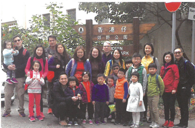
我們到達終點留影