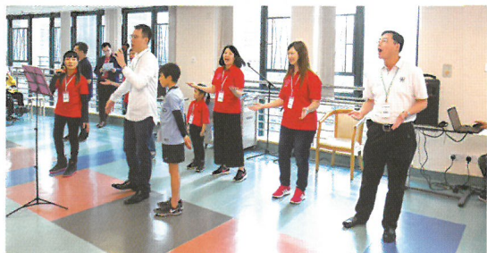
福音詩歌組以美妙歌聲傳揚福音