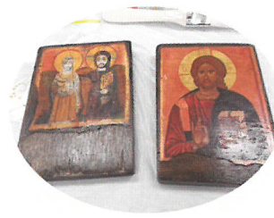
榮豐牧師講解聖像畫如何帶領我們尋找畫中的訊息