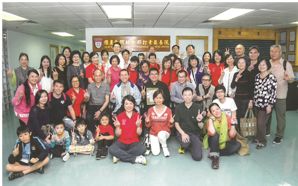
2017年4月8日成年部外展組第16次探訪那打素護養院。