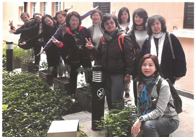
戶外活動樂在其中