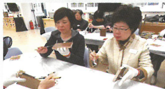
透過製作的工序，反思自己與上主的關係。