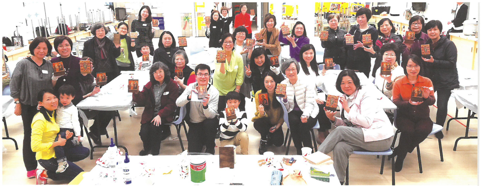
一起與自家手作的聖像畫來個大合照