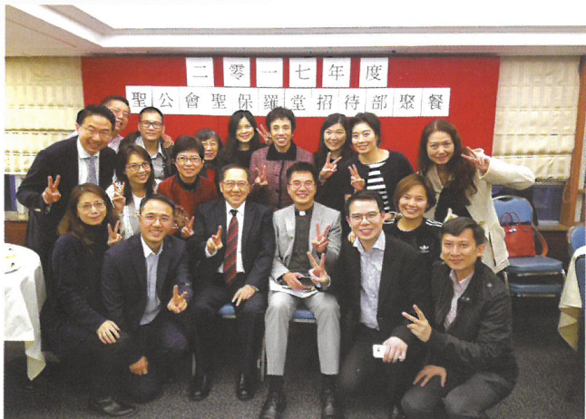
陳牧師經常在聚會及崇拜後祝福教友，婚禮中反被教友祝福。

不論昨日、今日、明天，招待部全人都會整裝待發、竭誠為各位服務，但願我們所行的，能得到大家、以及天父的悅納。