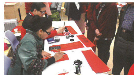
教友欣賞即席揮毫