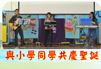
與小學同學共慶聖誕