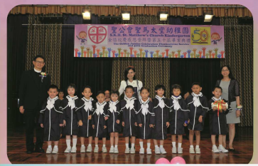
幼稚園畢業同學合照