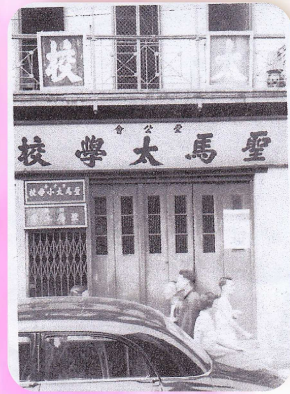
舊日的聖馬太學校