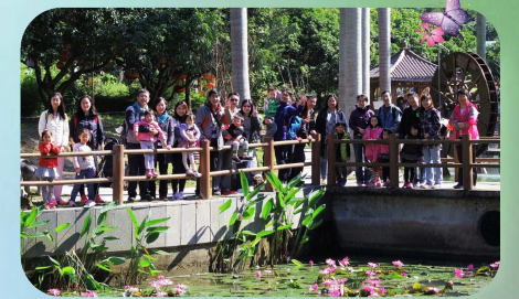
主日學家長小組親子旅行