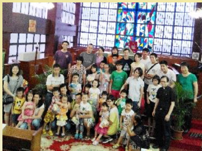
主日學升班日得獎學生及家長大合照