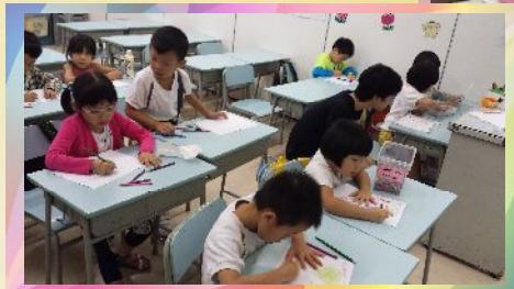
同學們開心愉快地學習英語

為了實踐愛鄰舍的為使命，由聖約翰座堂及聖馬太堂合辦的主日恩趣味英語班已於十月中開始。此活動主要為聖馬太堂幼稚園及聖馬太小學的移民同學服務，希望同學們透過學習英文能更適應新生活，亦讓他們感受到主耶穌的愛。