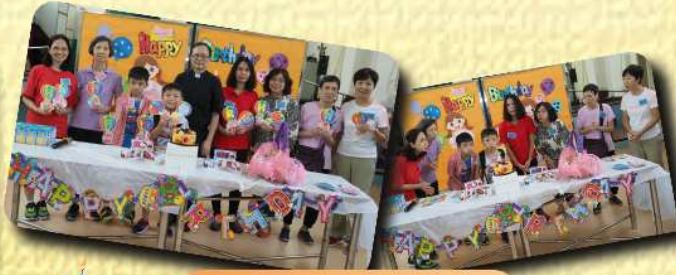
七至八月份生日會