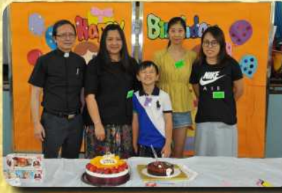
五至六月份生日會