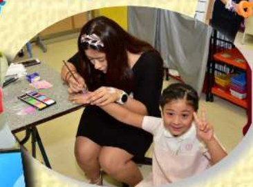
主日學 - 扭氣球攤位遊戲