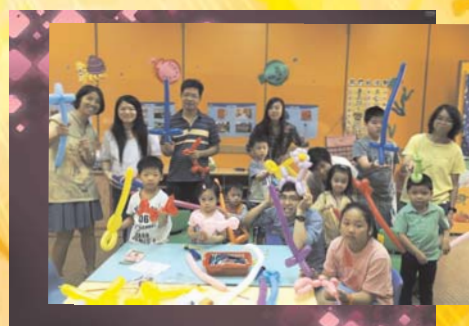
親子興趣活動 — 扭氣球