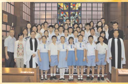
小學畢業同學大合照