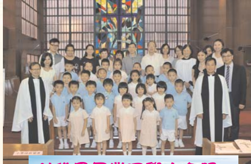
幼稚園畢業同學大合照