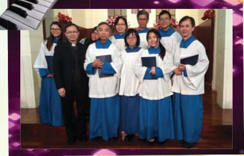
詩班 2015 廣州聖樂交流