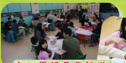
主日學親子興趣班