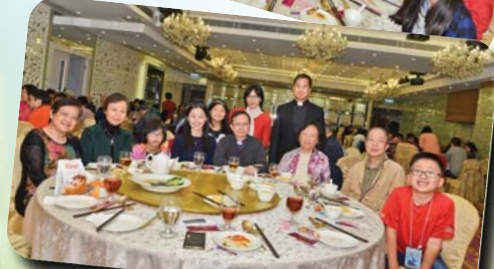
全堂教友歡聚，共進晚餐，氣氛熱鬧！