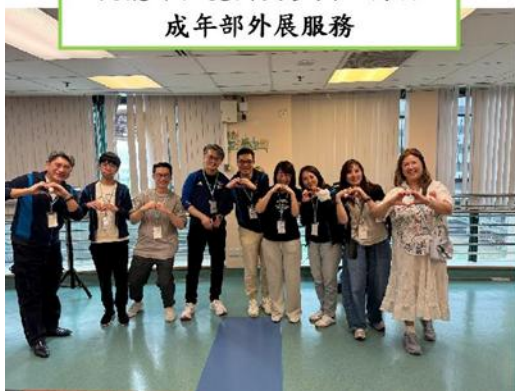
佻儷部仁愛團契參與3月份 成年部外展服務