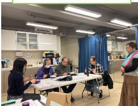
3月11日 常青團忘憂鼓班