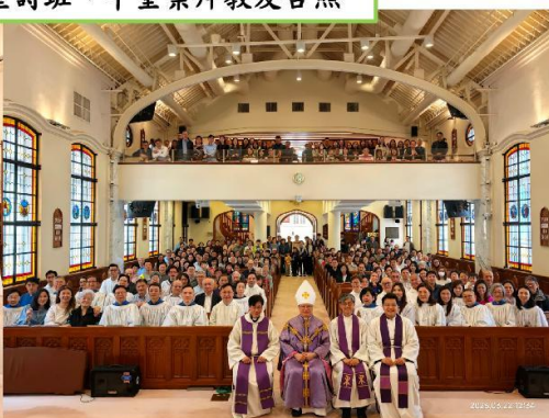
3月22日傳道部音樂團契：愛的食糧