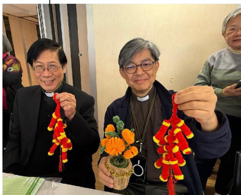
2月11日常青團 新年裝飾—爆竹一聲迎新歲/團年飯