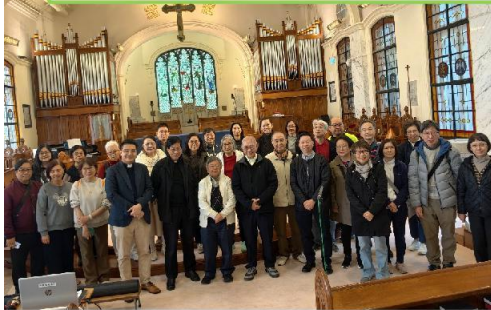
1月13日聖保羅堂和天主教主教座堂 合辦體驗「中區基督宗教合一之旅」