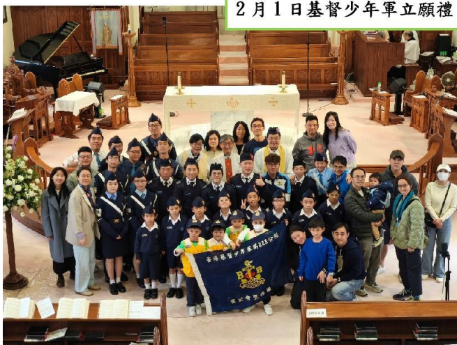
2月1日基督少年軍立願禮