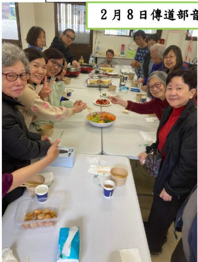
2月8日傳道部音樂團契：在主愛裡團圓