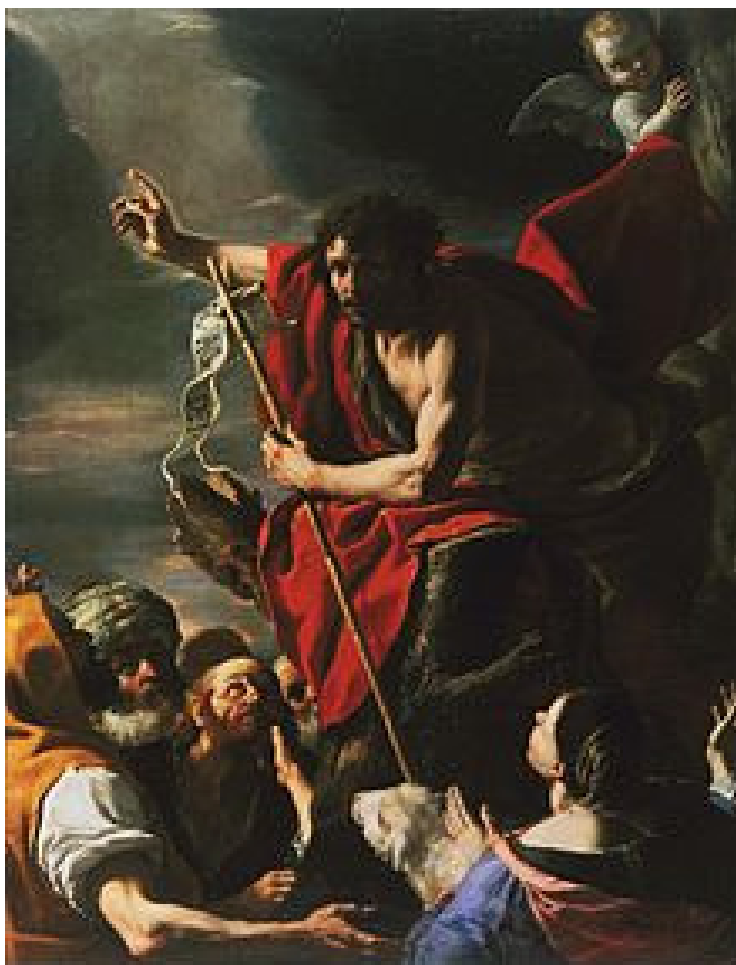
St. John the Baptist Preaching (施洗約翰傳道) Mattia Preti