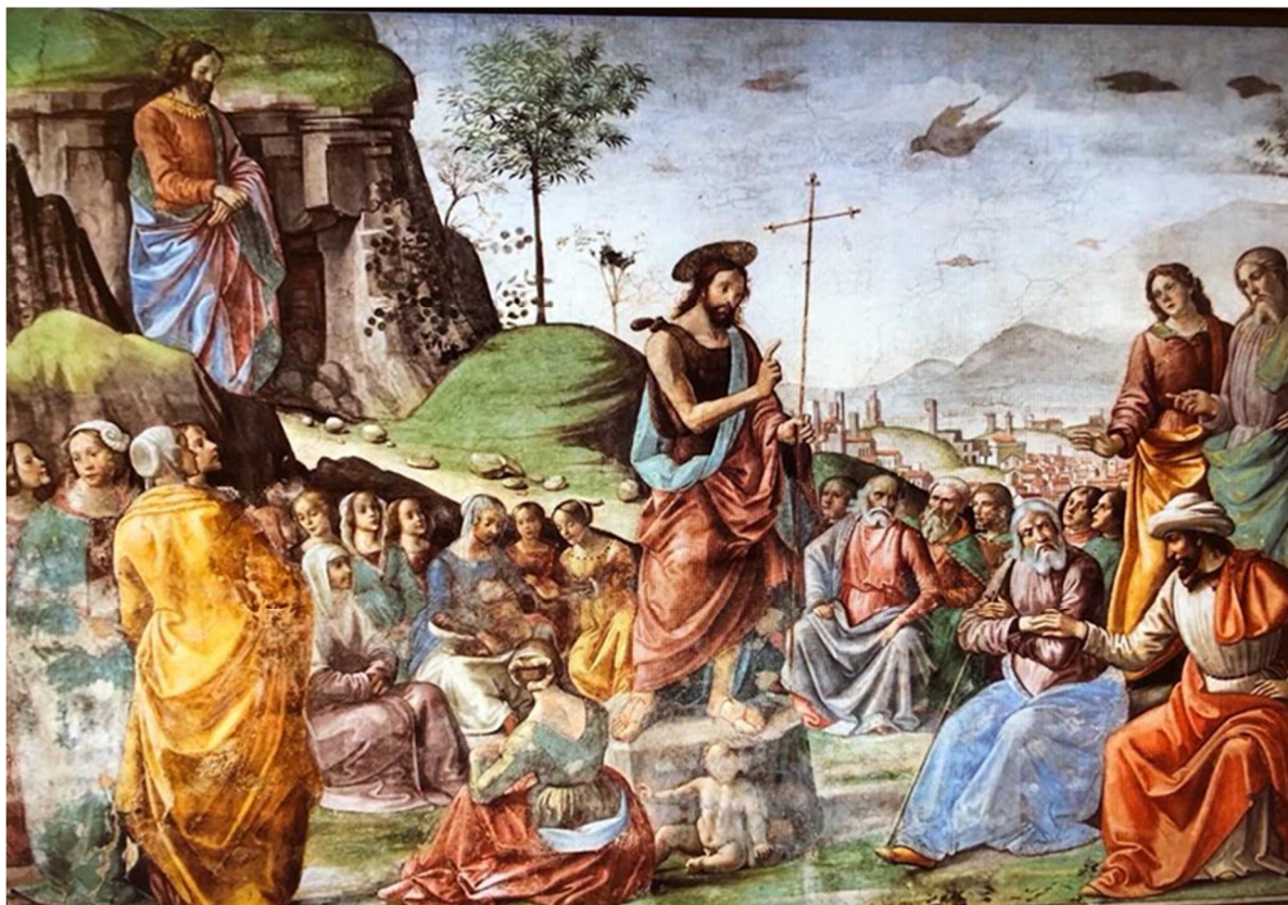
Preaching of St. John the Baptist (施洗約翰傳道) Domenico Ghirlandaio