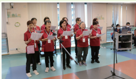
▲ 常青團團友獻唱福音粵曲。

林法政特別強調，「繼續下去」是很重要的態度，並鼓勵長者們切勿因身體受限或需要他人照顧而感到自卑或「沒用」。他更教導長者們可以透過簡單的祈禱，在每一天「繼續下去」為身邊的醫護人員及院友送上祝福。最後，林法政帶領眾人一同禱告，祈求上帝讓這份愛與關懷在院舍中傳遞，使每位長者能擁有從主而來的平安與安靜。