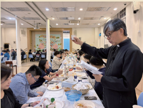
▲ 成年部主辦逾越節晚餐