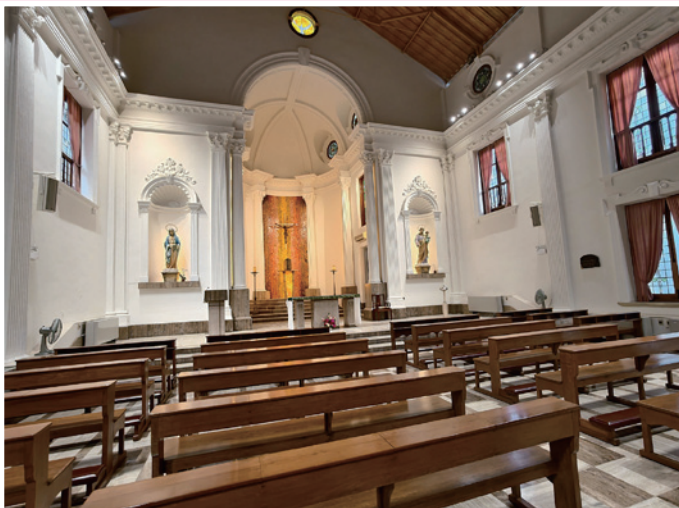
▲ 嘉諾撒仁愛女修會教堂。