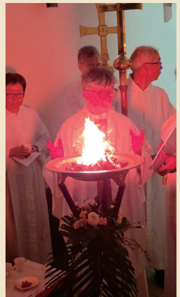
▲ 救主復活日守夜禮儀燃點新火。