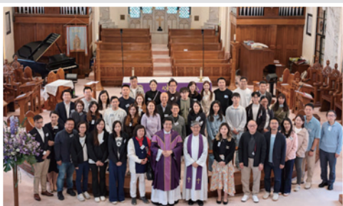
本堂首次為候洗者辦傅油禮儀