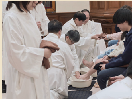
▲ 設立聖餐日崇拜濯足禮