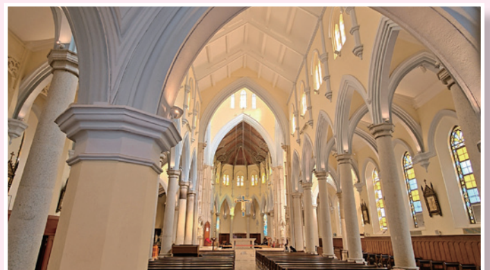
▲ 天主教聖母無原罪主教座堂。