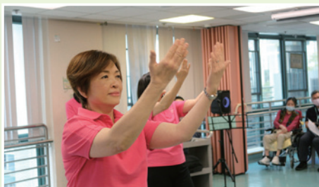
▲ 婦女部成員大跳讚美操。