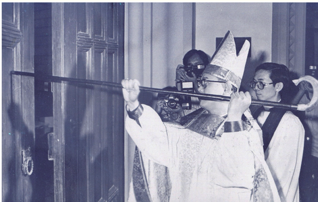
▲ 1981年鄭廣傑就任港澳教區主教。

他強調，現在不是「柴娃娃」的時候，基督徒必須有使命感，發揮光和鹽的作用。人要多點思考，不要被人牽住鼻子走，要有獨立思考，分析能力，推敲能力。