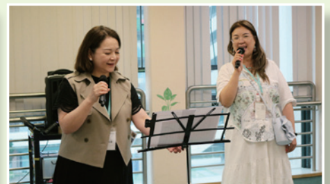
▲ 教友們合唱金曲讓長者們聽出耳油。