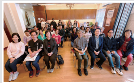
深讀舊約：在五經中遇見真光