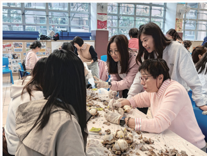
▲ 梁校長在水仙花切割工作坊親自教導學員切割水仙球。

梁校長鼓勵家長們與孩子「親子栽種」，讓孩子參與種植過程，一起見證植物的生長。活動結束前，她引用《傳道書》提醒家長們：「凡事都有定期，天下萬務都有定時……上帝造萬物，各按其時成為美好。」在等花開的日子，我們也學習以同樣的智慧澆灌家庭：不急躁、不比較，按着時候耐心耕耘。