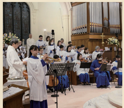
▲ 聖樂部樂器小組在救主復活日崇拜中伴奏。