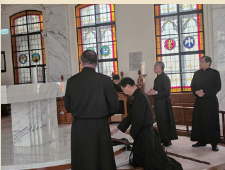
▲ 救主受難日向十架敬禮。