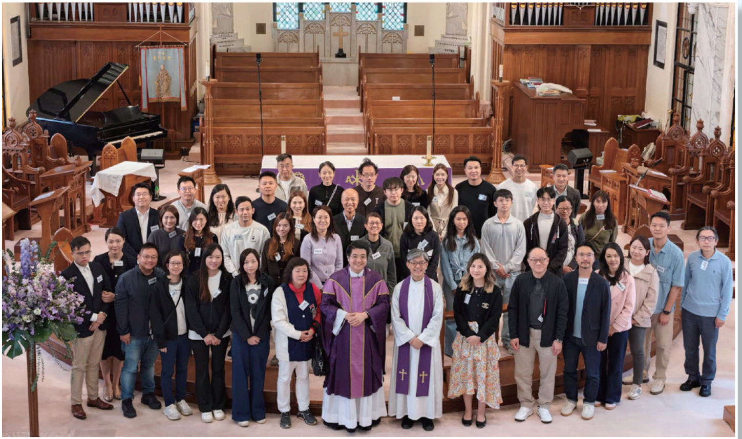
▲ 候洗教友在傅油禮儀後與牧者合照。

2026 年大齋期與聖周期間，聖保羅堂透過一連串崇拜禮儀帶領信眾走過一段「由預備到更新」的信仰之路。當中包括首次舉行傅油禮，堅固準備接受聖洗禮的慕道學員的心志。