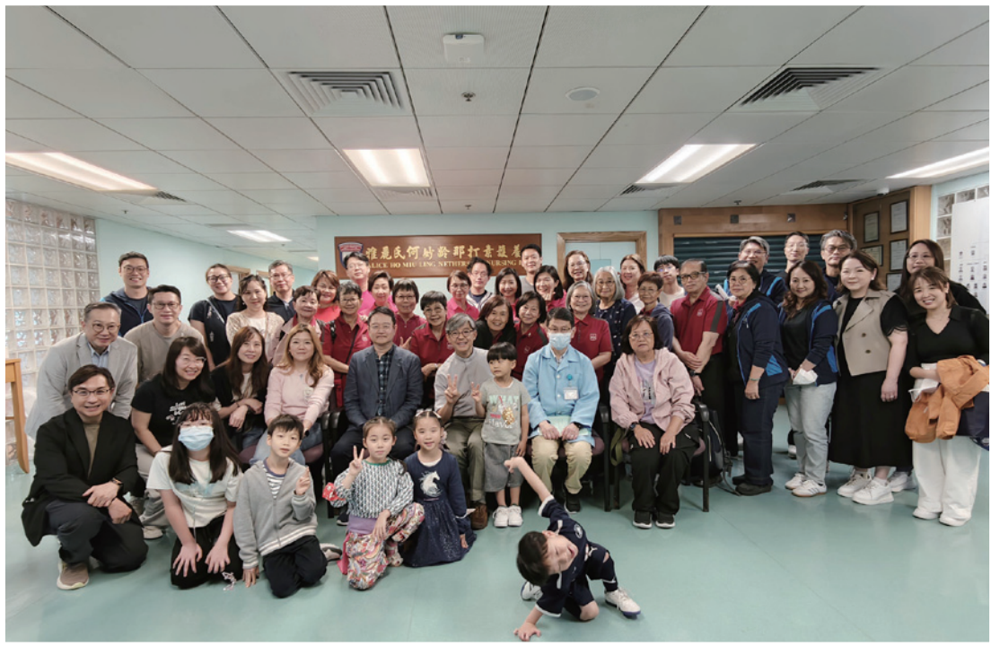
▲ 成年部外展探訪活動自 2012 年起已進行了 30 次。

本堂成年部於 3 月 28 日舉行了第 30 次長者探訪活動，約 50 位來自不同地區、不同年齡層的教友齊集於九龍灣雅麗氏何妙齡那打素護養院，與數十名長者共度一個溫馨愉快的下午。