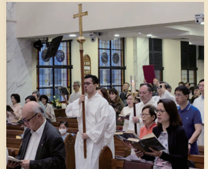
▲ 救主復活日午堂崇拜。