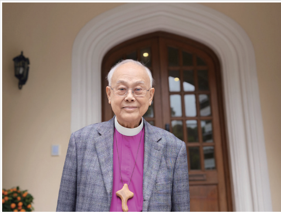
▲ 鄺廣傑榮休大主教退休後仍每天到教省辦事處上班。

其後，受到聖靈的感動，仍是少年的鄺榮休大主教鼓起勇氣，向父母表達接受洗禮的意願。感恩父母的態度開明，並未有阻撓。他的父親更謹慎地為他尋找一家「正正經經和可靠的教會」。眾裏尋她，終於找到座落於中環鐵崗的聖保羅堂成為鄺榮休大主教的「第二個家」。那年，是1950年；那年，他14歲；那年，他與聖保羅堂開始建立深厚情誼。