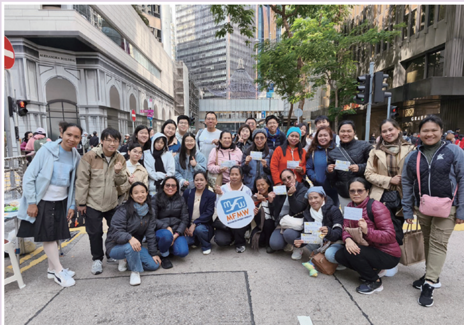
▲ 聖保羅堂主日學部中學組同學到中環街頭探訪外傭。

從因為缺乏私人空間而要在寒風中瑟縮，到為了生計而錯過子女成長的遺憾，同學們在交談中深受觸動。她們的辛酸，讓我們反思自己擁有的幸福並非理所當然；她們在逆境中的堅韌與樂觀，更為我們上了一堂寶貴的生命教育課。