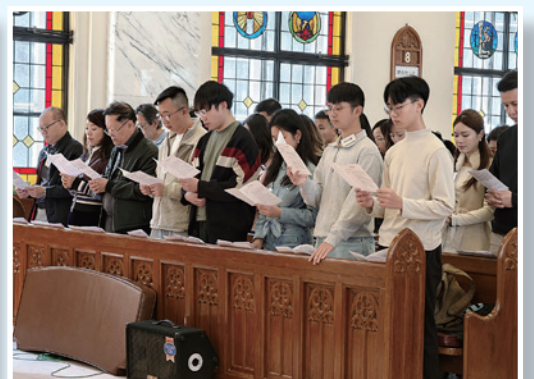
▲ 一眾候洗者回應林法政的察問。